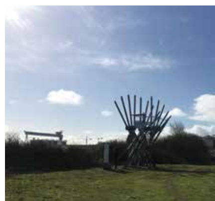
le sémaphore, à l'embouchure du Brivet