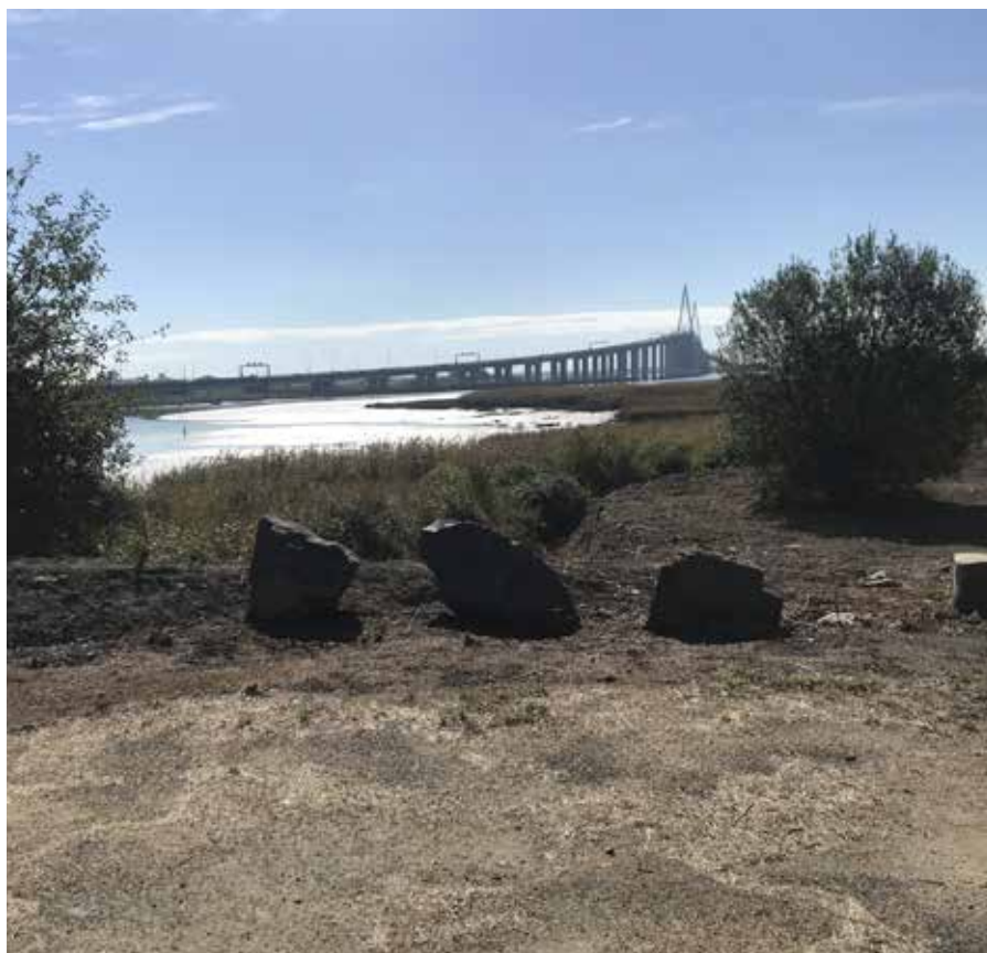
vue sur le pont de Saint-Nazaire et la vasière de Méan depuis le terrain

> favoriser des modes de déplacement et de tourisme alternatifs