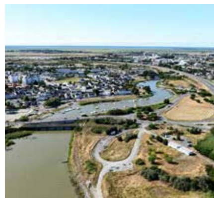
vue sur le Brivet et le port de Méan